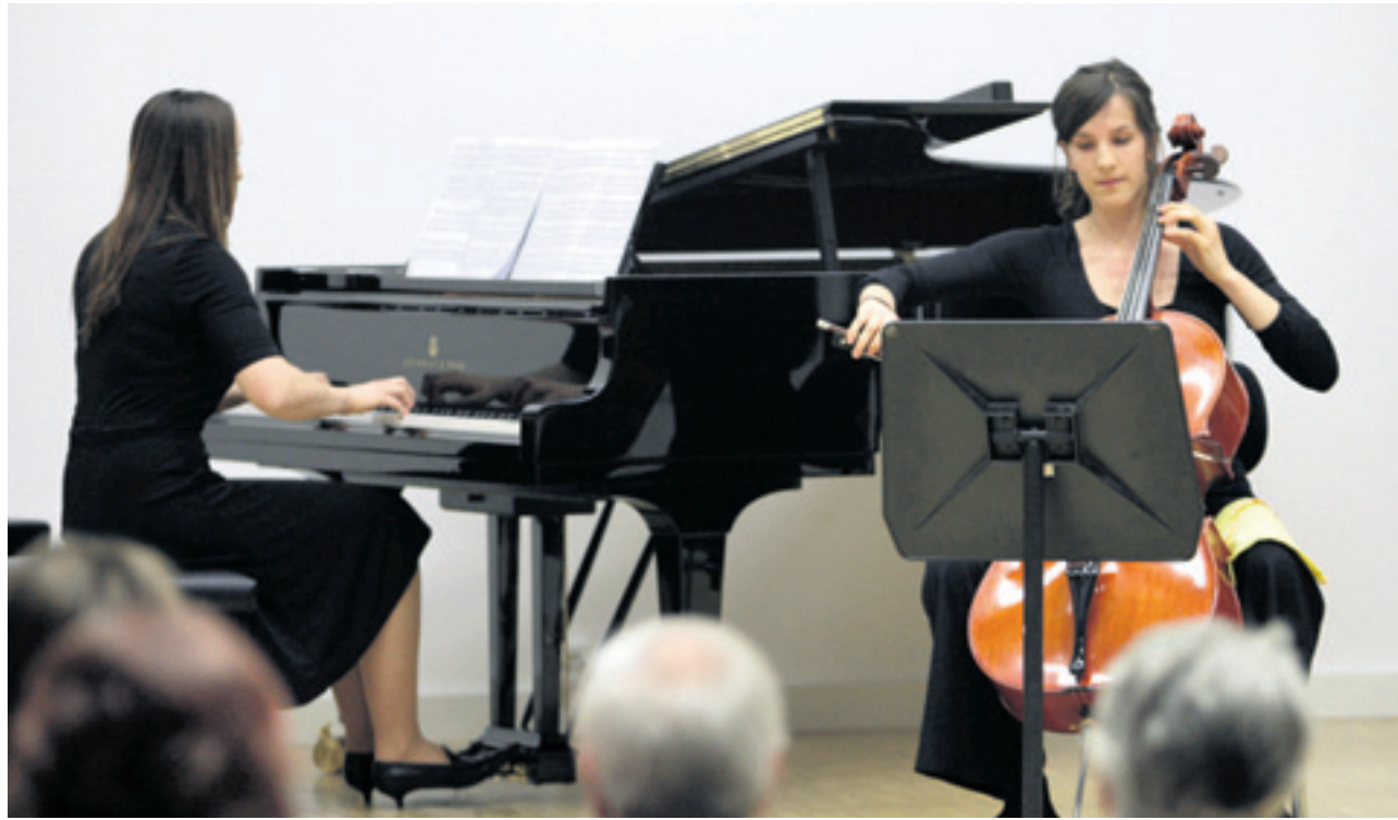
Abschlusskonzert der Meisterkurse: 16 junge Ausnahmetalente aus Europa konzertierten im Eschner Musikschulzentrum.

Am vergangenen Freitag hat im Eschner Musikschulzentrum das zweite Abschlusskonzert der Meisterkurse für Klavier, Cello und Kammermusik mit 16 europäischen Ausnahmetalenten im Alter von zehn bis achtzehn Jahren stattgefunden.